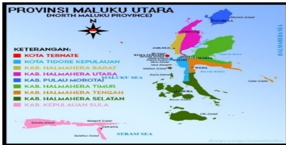
Gambar: Peta Provinsi Maluku Utara

Wilayah Kerja Balai POM di Sofifi mencakup 9 Kabupaten/Kota sebagai berikut: